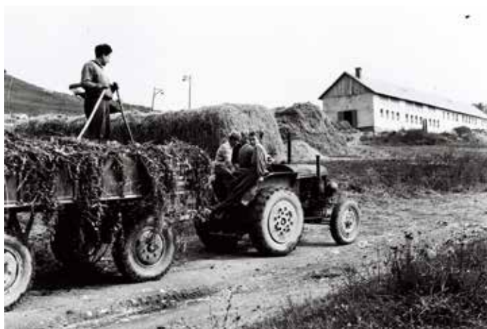
Žiaci brigádovali aj pri družstevných kravinách