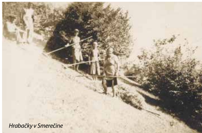
Hrabačky v Smerečine

celkom suché seno sa zhrabalo do kôpok. Veľa starších žien chodilo za skromným zárobkom na tieto práce. Obdivovala som ich, veď len zájsť na Chodorove vrch, Za vrch dolín, alebo na Diel bol výkon. Teploty sa vyšplhali po niektoré dni aj na 33 stupňov. Staršie tetušky vydržali v tmavých háboch so šatkami na hlave hrabať v tej pálave, boli na každodennú ťažkú prácu zvyknuté. Jedlo a pitie si každá priniesla v chrbtovom košíku. V sklenených fľašiach si nosili bielu kávu alebo čaj. Plastové fľaše sme v tej dobe nepoznali. Naša stará mama zobrala z domu na vodu veľkú plechovú kandličku, teta od susedov hlinenú hampuľu. (Bola podobná