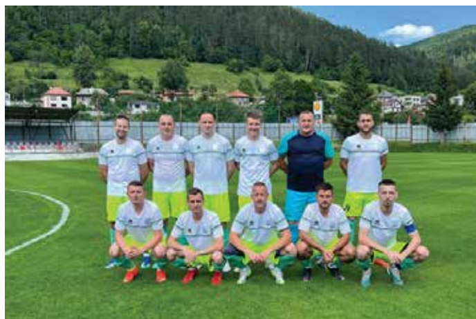
Posledný domáci zápas Valaská : Malachov 2:0, 15. 6. 2024.