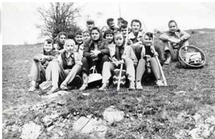
Starší žiaci čistili lúky a pasienky